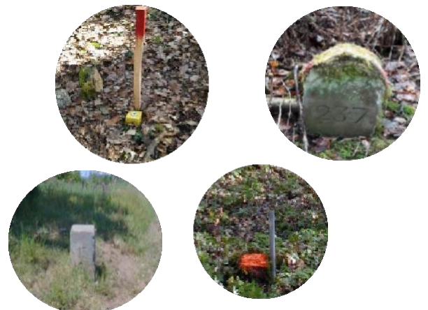
Exemples de bornes