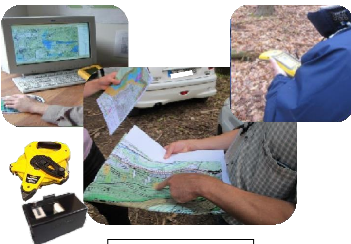
Du bureau au terrain

En l'absence de certitude sur la localisation d'une limite, il est impératif de faire appel à un géomètre expert pour faire réaliser un bornage contradictoire indiscutable. Vous pouvez aussi demander l'aide de vos voisins de parcelles.