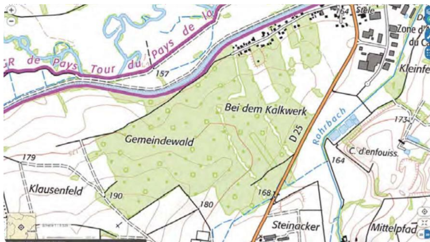
Cartes de situation du massif forestier Gemeindewald/Kalwerk

Le massif n'est pas en urgence sanitaire, cependant certaines essences présentent des signes de dépérissement dû au climat, à des pathogènes ou encore à la trop forte densité d'arbres sur certaines zones. Sachant que la situation climatique risque de se dégrader dans les prochaines années, un entretien au sein du massif ne serait que bénéfique pour celui-ci.