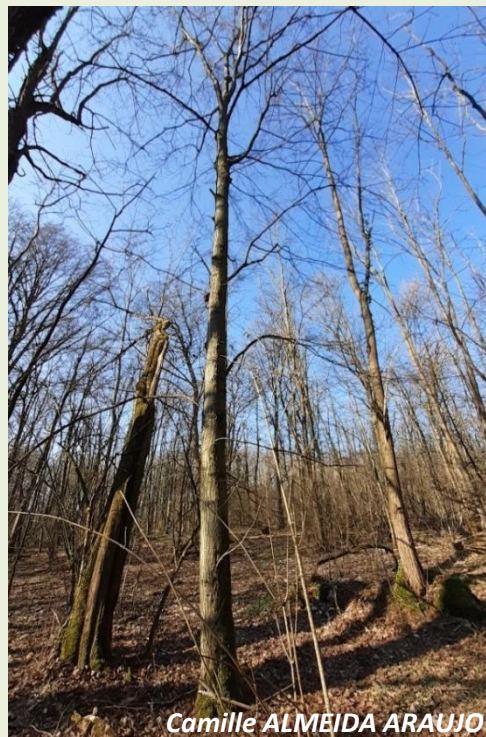
Camille ALMEIDA ARAUJO