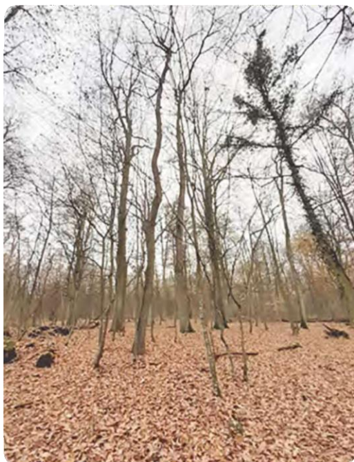
Photo prise sur une parcelle de chêne de la forêt du Gemeindewald/Kalwerk Source: Camille ALMEIDA ARAUJO 03/12/2020

Cette forêt oubliée mériterait qu'on s'y intéresse à nouveau. Le terrain est propice à des forêts de chênes de qualité, qui auraient besoin d'un coup de main. Un accompagnement des propriétaires forestiers par les conseillers spécialisés de la Chambre d'agriculture permettrait un suivi sur le massif et une gestion durable de sa ressource forestière.